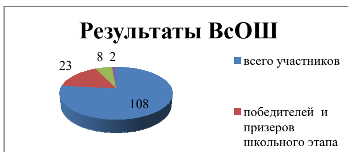
Диаграмма по результатам участия школьников во ВсОШ

В 2023/24 году в рамках ВсОШ прошли школьный и муниципальный этапы. Сравнивая результаты двух этапов с результатами аналогичных этапов, которые прошли осенью 2022 года, можно сделать вывод, что количественные и качественные показатели снизились.